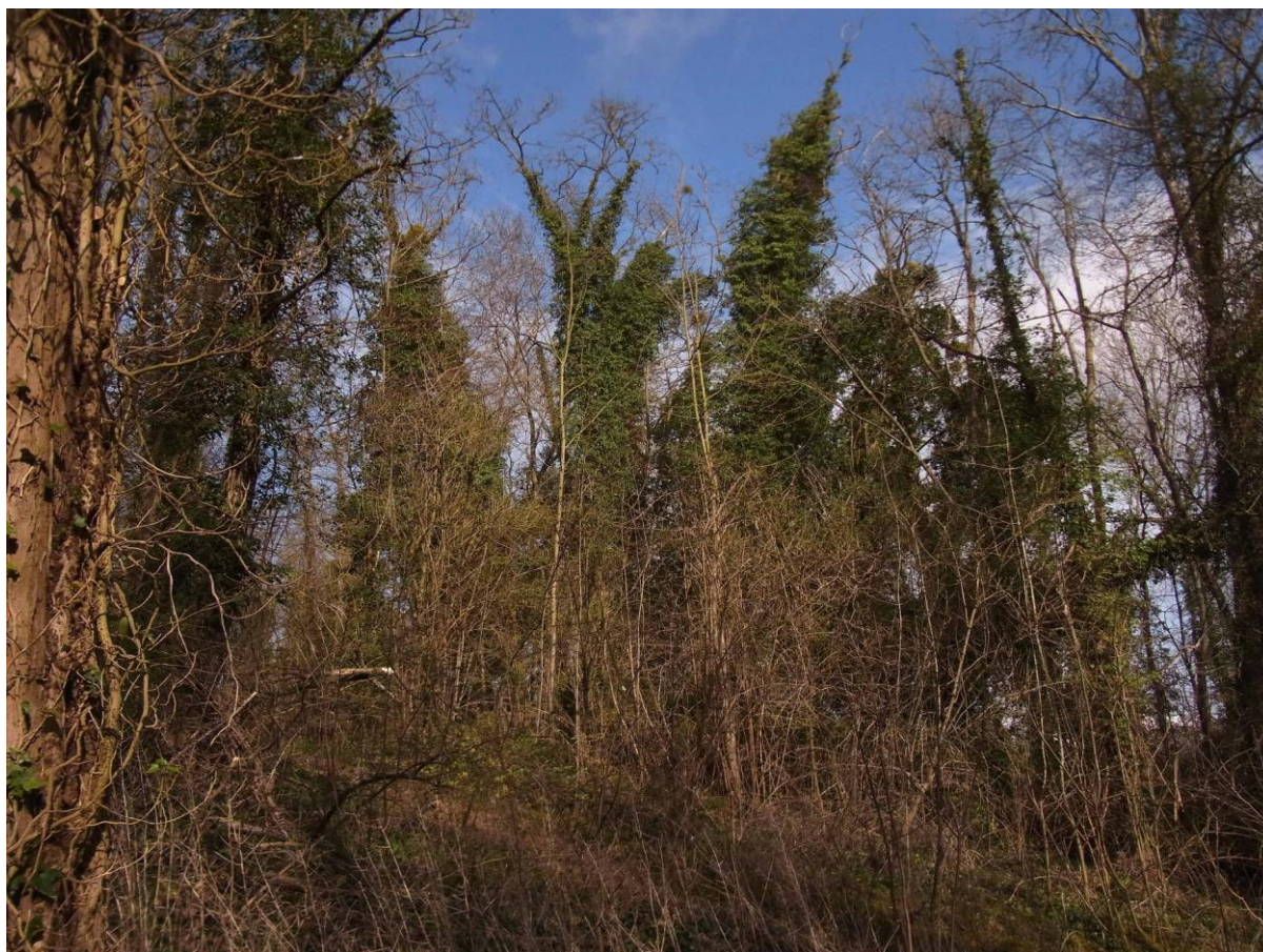
Les arbres à lierre de la Forêt de Vauréal, étape très appréciée des Grives mauvis avant leur retour vers les régions septentrionales.

Au milieu de cette effervescence, quelques Grives musiciennes locales, dont une commençant à faire entendre un chant pas encore complètement assuré.