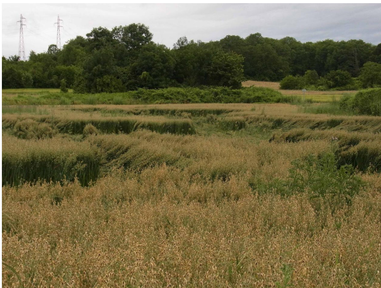
Au retour, entre Jouy et Maurecourt : champ d'avoine.

Comme plus haut sur le coteau, chante un Roitelet triple-bandeau, toujours lié, en l'absence de conifères, aux arbres à lierre.