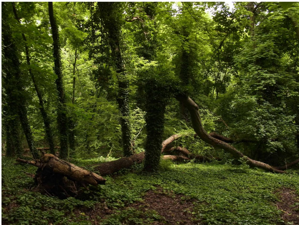
La forêt du coteau au début de l'été.