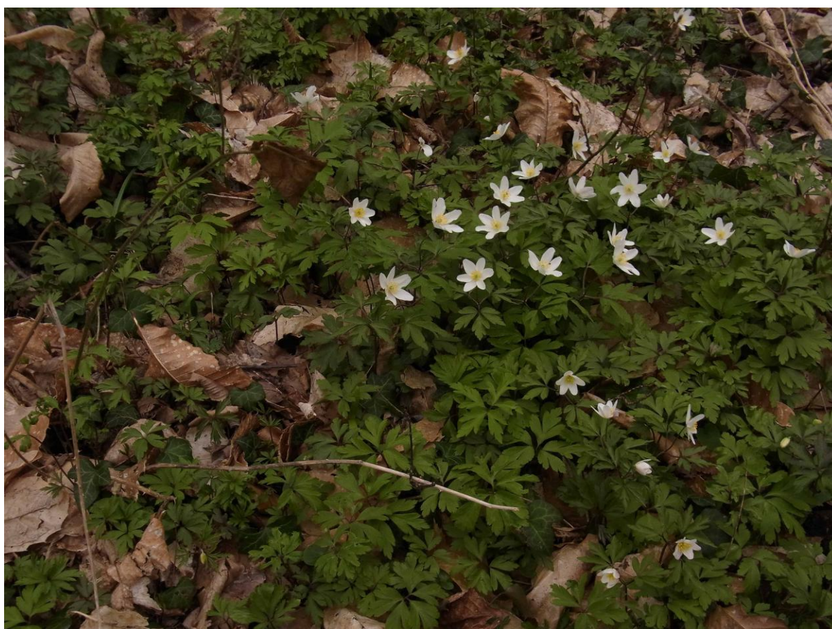
Dans le Bois de Lieux. Vieux merisier et anémones sylvies à la fin mars.