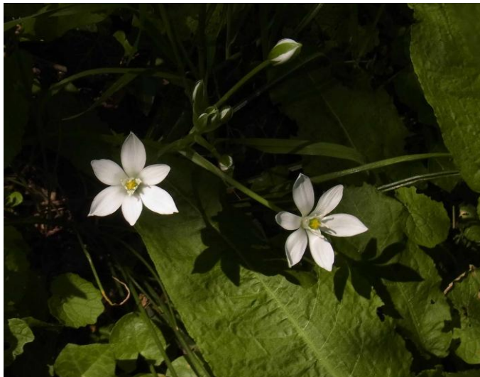
Ornithogale en ombelle

Nous envisageons d'aller retrouver un vieux sujet de nerprun purgatif le long du sentier de la lisière supérieure du bois du coteau, peut-être à l'origine de sujets plus jeunes plus bas dans la pente. Après le cimetière, en bordure du chemin, découverte inattendue d'une ornithogale en ombelle Ornithogalum umbellatum . En montant, belles stations de mélisse ( Melica uniflora ) le long du sentier, graminée forestière beaucoup plus abondante dans le Bois de Lieux. Ici, nous n'en sommes pas très loin, mais lorsqu'on s'éloigne de ce massif, on ne la trouve plus. Encore une plante