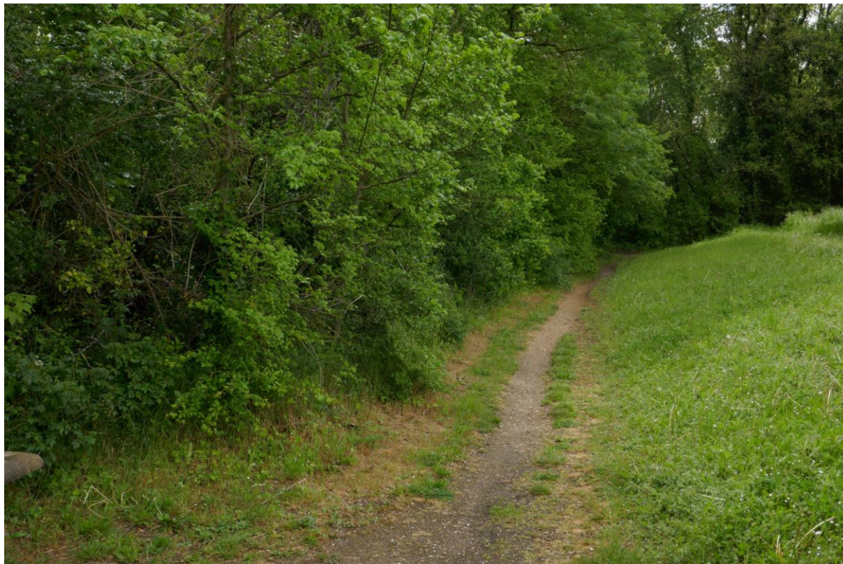
Sentier de la lisière ouest des bois du coteau, vers le « Belvédère ».