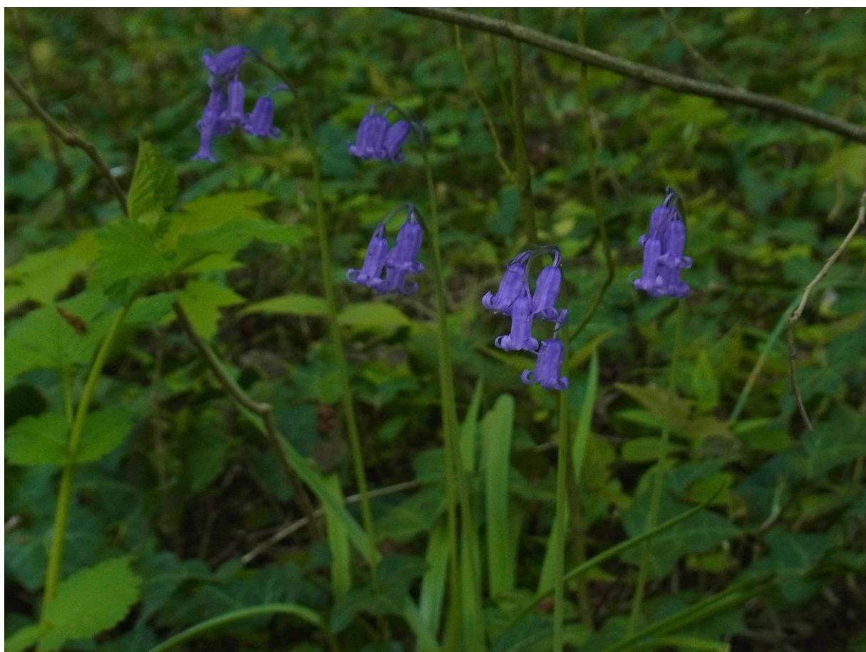
En bas, nouvelle station de Jacinthe des bois Hyacinthoides non-scripta dans les bois du coteau de Vauréal, à l'évidence due à un transport de graines par des ongulés depuis le Bois de Lieux où existent de vastes tapis de cette plante (en haut).