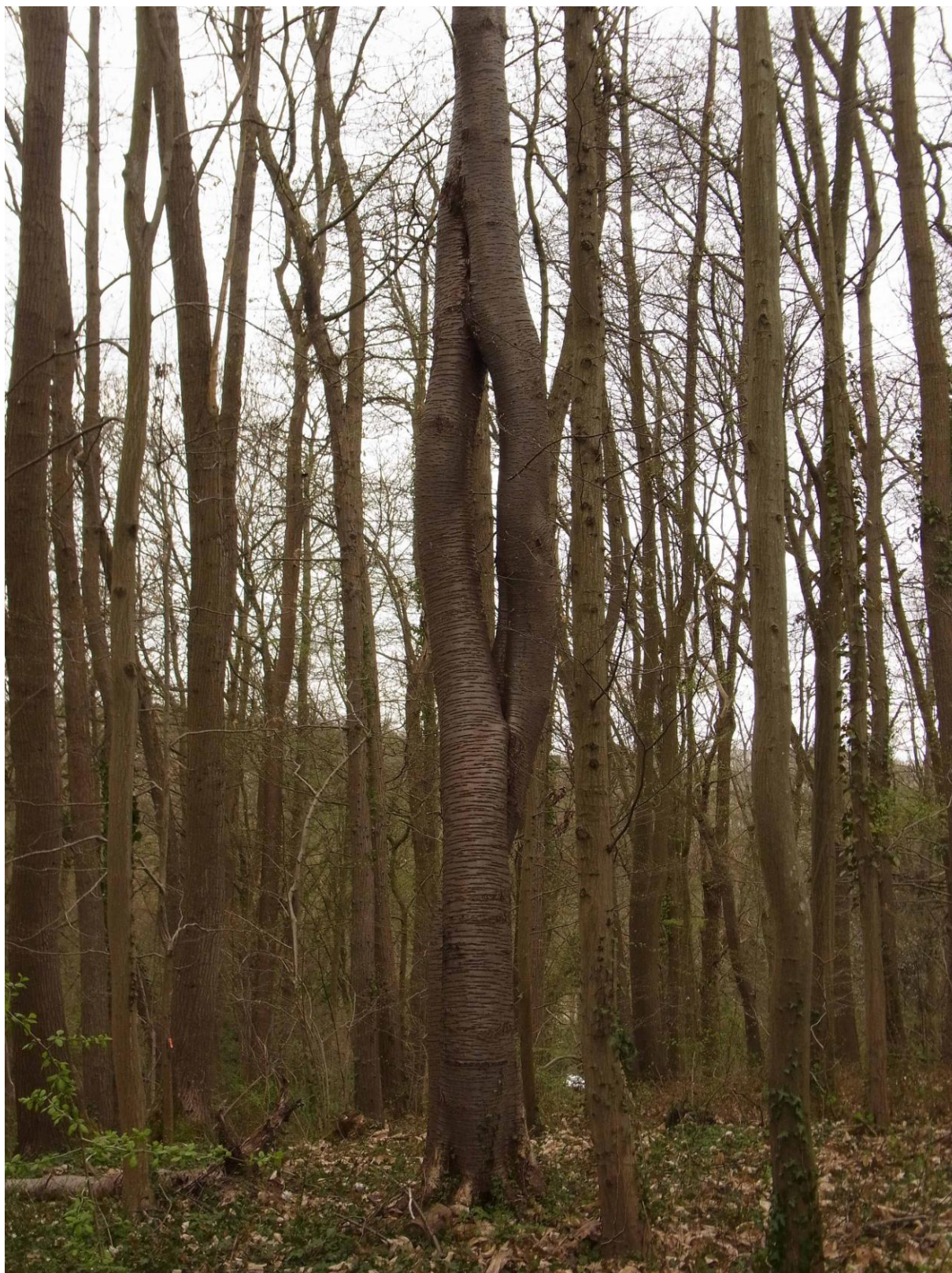
Un curieux merisier du Bois de Lieux.