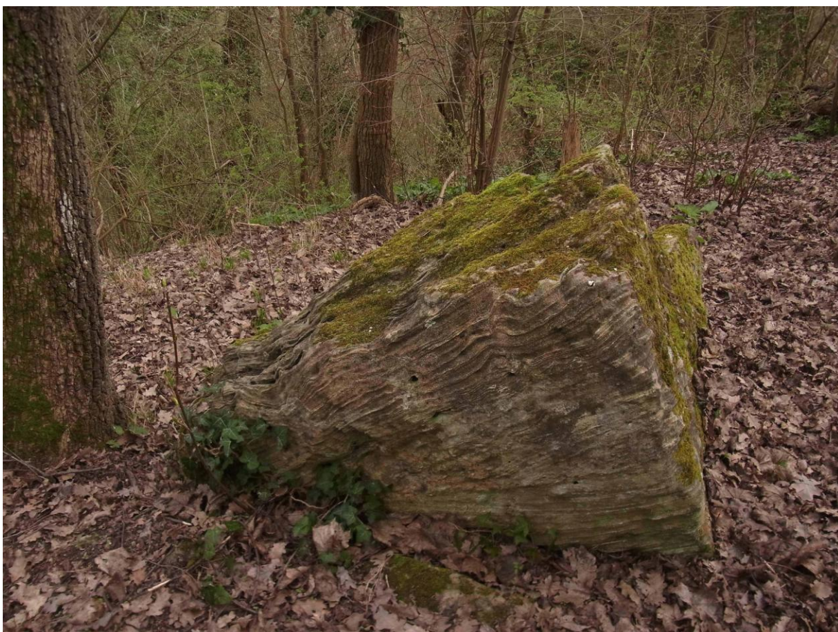
Bancs de roche en feuillets dans les bois du coteau.