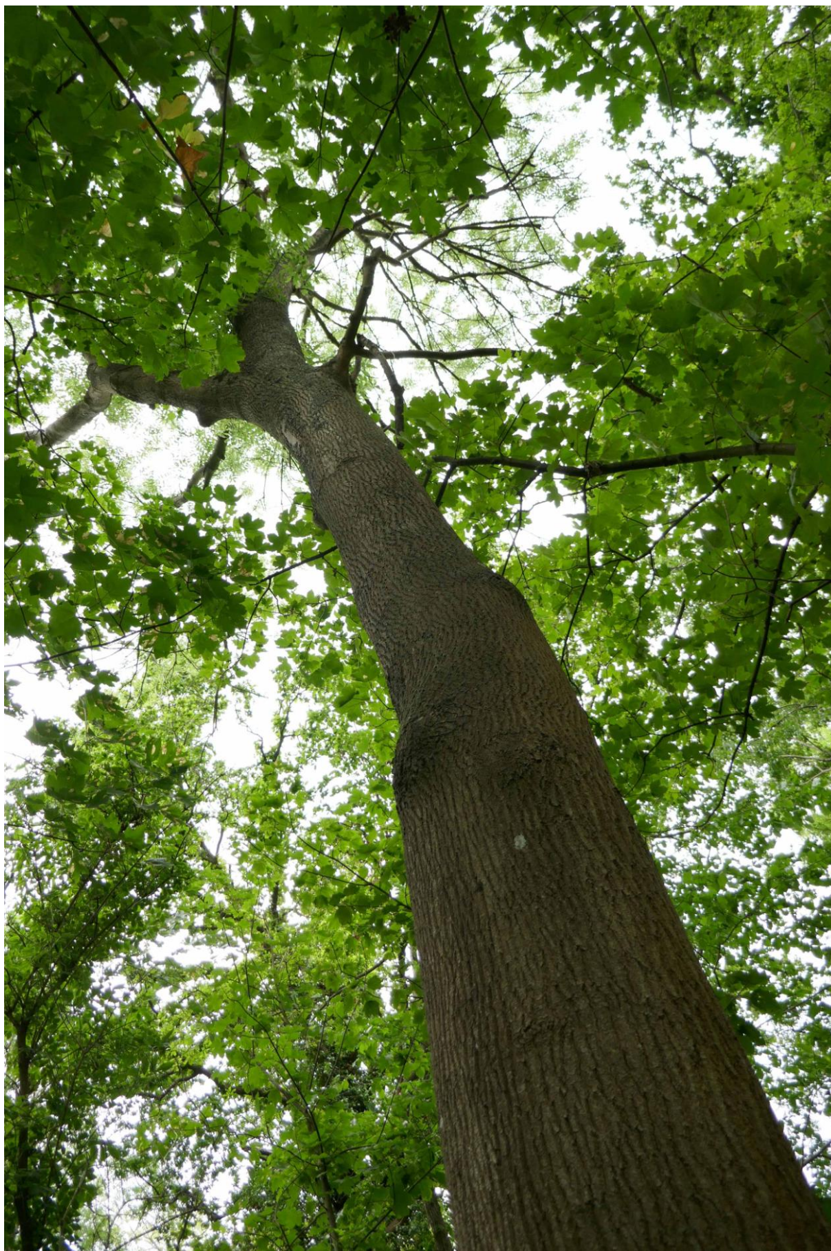
Grand frêne des bois du coteau.