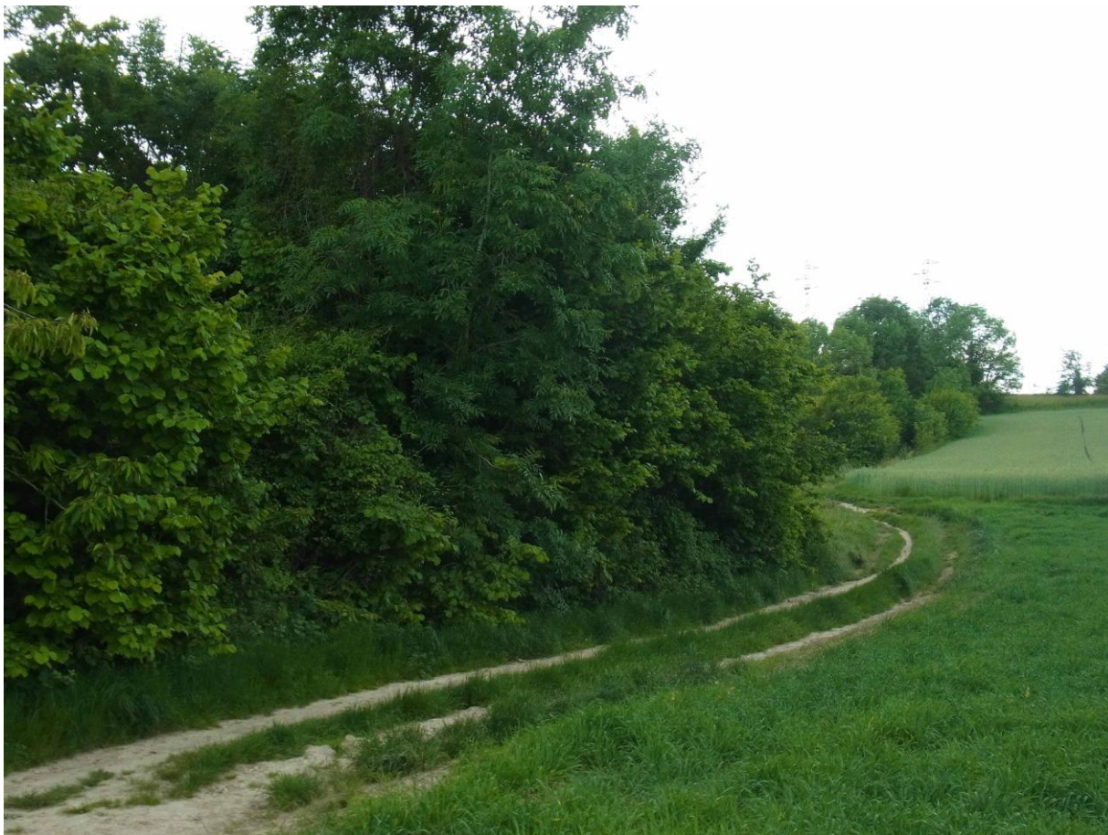
Entre Jouy-le-Moutier et Maurecourt.

Retour en passant par le chemin de terre entre Jouy-le-Moutier et Maurecourt, au lieu de prendre la route. Cela me permet de mieux apprécier, au rythme de la marche, ce paysage campagnard avec champs, haies, vieux murs et bosquets entre les deux bourgs. Et aussi de voir et entendre un certain nombre d'oiseaux caractéristiques du milieu rural : Alouette des champs qui chante vers le haut du coteau, un Bruant zizi chanteur à la limite d'un jardin et d'un champ au-dessus de la route, au moins deux couples de Linottes mélodieuses dont les mâles chantent et une femelle a des matériaux pour le nid dans le bec. Avec le temps assez chaud, j'y entends par ailleurs plusieurs Grillons bordelais Eumodicogryllus bordigalensis . Qui s'appelaient autrefois Tartarogryllus ... Derrière ce nom barbare, se cache un petit grillon méridional qui est remonté peu à peu du Sud de la France, à la faveur d'un climat moins froid. Je le connais bien, l'ayant toujours entendu dans le Sud-Ouest, qui fait partie de sa patrie d'origine, d'où son nom. Une fois que l'on a son chant « dans l'oreille », on le reconnaît très facilement. Je l'ai aussi entendu à Gonesse, Luzarches... Il semble qu'il ait colonisé une grande partie de l'Île-de-France, où il a été signalé pour la première fois vers la fin des années 1990.