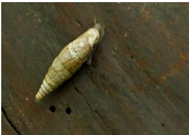
Fuseau commun (probable) sur un vieux tronc.

En fin d'après-midi, en repassant sur le sentier qui s'enfonce dans le bois après le cimetière, nous remarquons sur de vieux troncs pourrissants la présence de curieux petits escargots à coquille très allongée allant du brun-noirâtre au beige, beaucoup plus longue que le corps, appartenant à une espèce qui ne semble pas très courante. Ils sont sortis nombreux après cette journée pluvieuse. Seul le temps de pluie permet de déceler ces très discrets gastéropodes... D'après le Guide des escargots et limaces d'Europe, il s'agirait du « Fuseau commun » Cochlodina laminata . Le guide précise