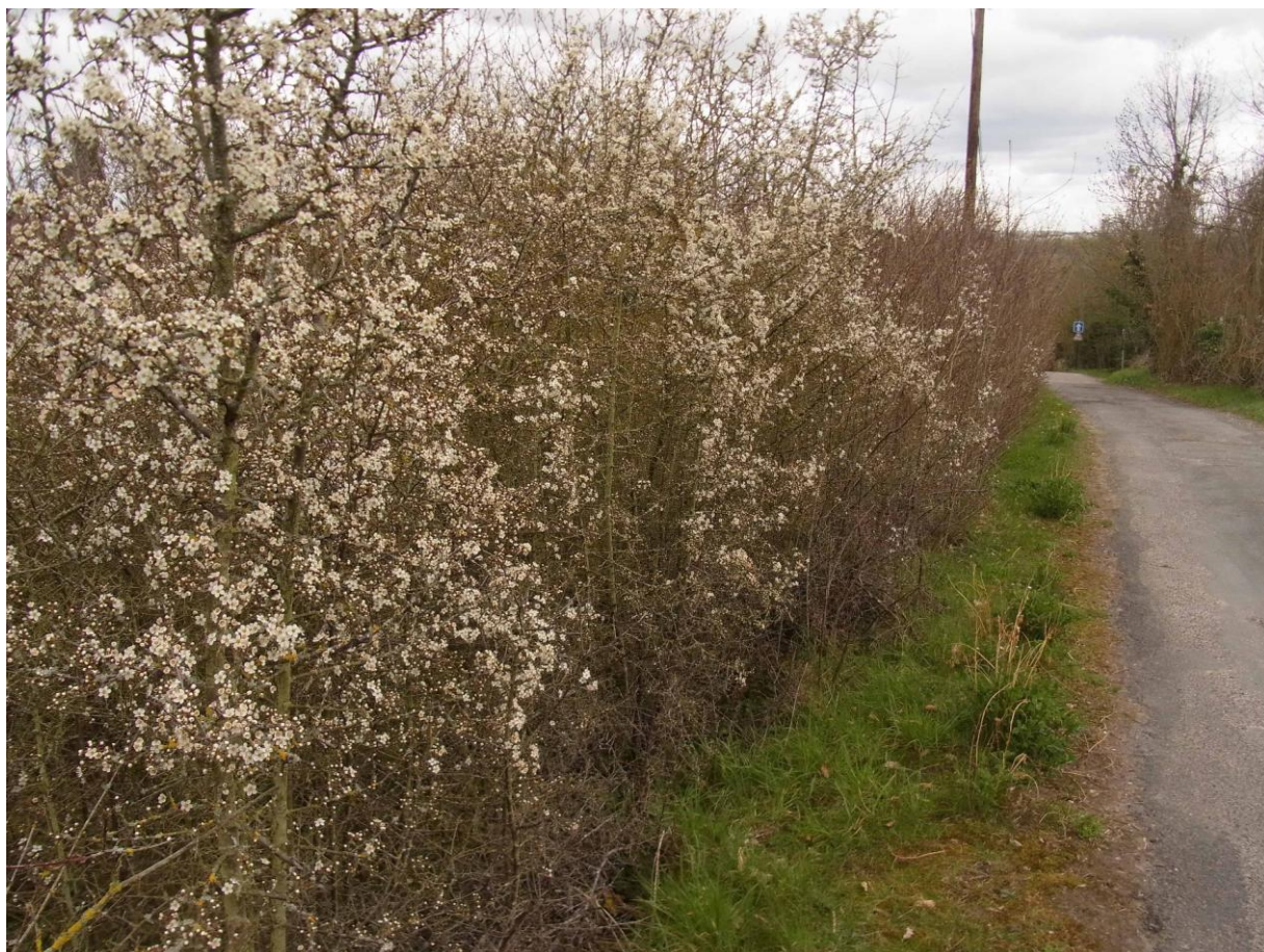
Haie naturelle de prunelliers dans la côte des Carneaux.

Chants printaniers, très sonores, des Pics verts, dont un se trouve sous la Sente Bien-Aimée aux environs de la grande prairie.