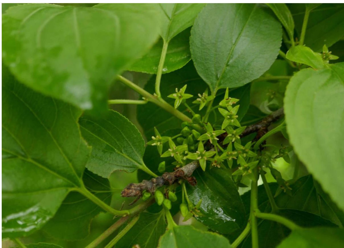
Le vieux nerprun purgatif Rhamnus cathartica en fleurs (mai 2021).