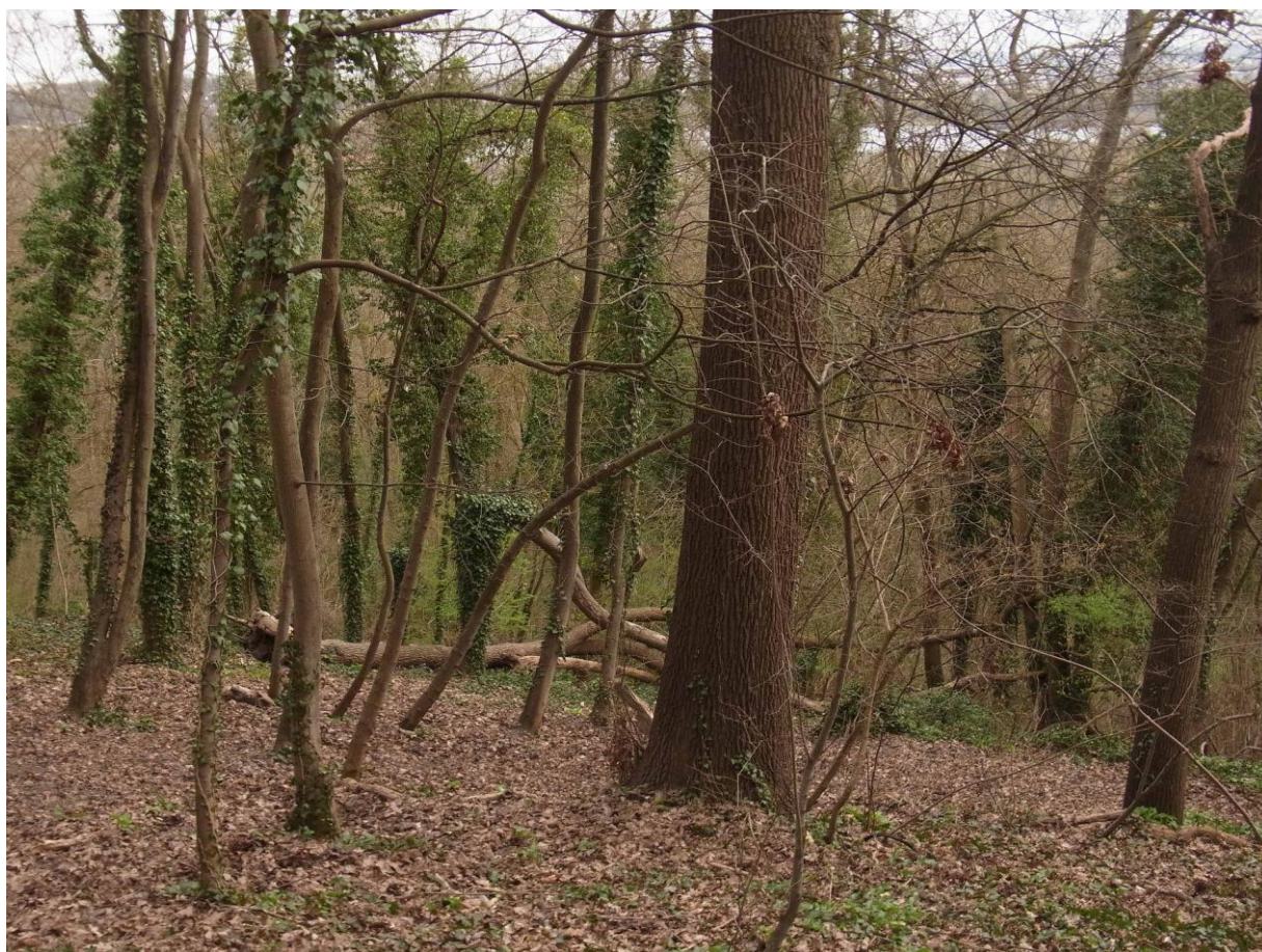
Entre les Loctaines et la côte des Carneaux.

On entend également le chant suraigu de Roitelets triple-bandeau dans les arbres à lierre de plusieurs secteurs de la forêt : il peut s'agir déjà des niches locaux, bien qu'à cette époque beaucoup de sujets migrateurs passent et chantent lors d'une halte de quelques jours.