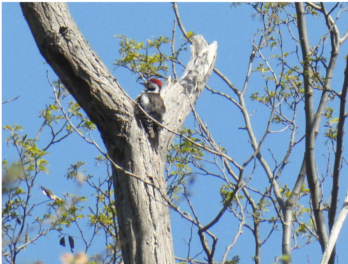
Le Pic mar se chauffe au soleil... 26 avril 2021.

Deux Fauvettes des jardins, arrivées depuis peu, chantent dans cette partie haute de la forêt du coteau. Autres petits insectivores en transit, les Pouillots fitis font aussi entendre leur chant un peu partout. Mais ils ne resteront que quelques jours et continueront leur route migratoire. En redescendant, encore un beau sujet de Prunus mahaleb tout en fleurs. Il apparaît au fil des cheminements dans ces bois que ce petit arbre n'est pas seulement confiné aux seuls coteaux calcaires les plus typiques de la vallée de la Seine. Il est beaucoup plus répandu et remonte la vallée de l'Oise. La dispersion par les oiseaux est la cause principale, pourvu que le climat, l'exposition et le sol restent convenables pour l'espèce.